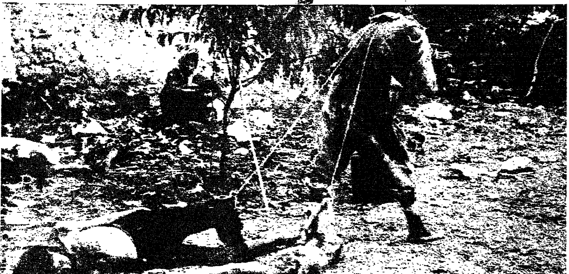
جثث ضحايا المجاعة ... هكذا كانت تنقل من الطرقات

واصيب اللبنانيون بالفقر من الضرائب المرتفعة التي كانت الحكومة التركية وضعتها، وعندما هبت علة الوبق التركي في شهر شباط ١٩١٧ بشكل ملحوظ ازداد ارتفاع ثمن البضائع والغذاء الى درجة فاحشة، وبقي يزداد ويزداد.